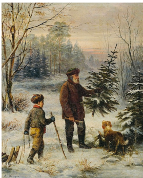
Franz Krüger Vorweihnacht

In de 16 e en 17 e eeuw werd het een traditie om een rijk versierde boom in huis te plaatsen. Met veel appeltjes in de boom, een verwijzing naar de zogenaamde Adam- en Eva-dag op 24 december. Daarbij werden toneelstukken en verhalen opgevoerd met bijbelverhalen. Daarom is het misschien in Duitsland nog steeds traditie om de boom pas op te tuigen op 24 december! Het gebruik van versierde kerstbomen werd daarna snel overgenomen door de Britse adel waarna dit gebruik zich over de rest van Europa verspreidde. Omstreeks 1800 namen Duitse emigranten de kerstboom-traditie mee de oceaan over naar de Verenigde Staten.