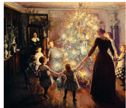
Viggo Johansen, Heilig Abend

In de late middeleeuwen rond 1500 werd het tevens een christelijk winterfeest. Dit werd het feest van de geboorte van Jezus Christus! Vooral in de Duitse landen en Scandinavië. In een Rooms-Katholieke kathedraal in Staatsburg in 1539 werd er al een grote kerstboom in de kerk gezet. In Riga in Letland versierde een lokale gilde een boom met kunststroen, danste eromheen en stak de boom in de fik. Lijkt op een Haagse traditie!!!